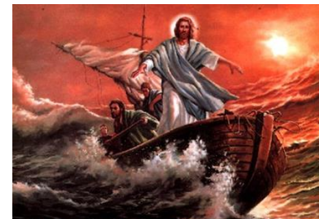
Jezus ucisza burzę na Jeziorze Galilejskim